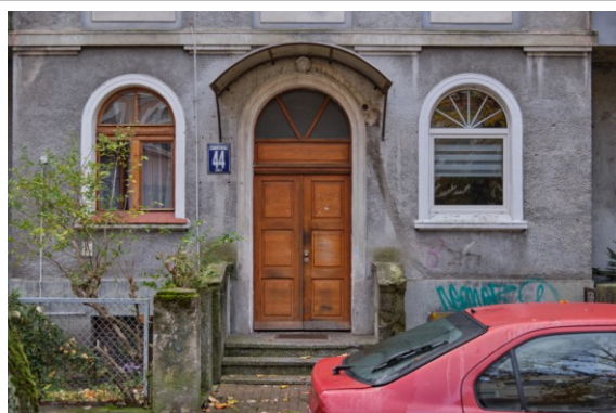
Widok parterowej części ryzalitu