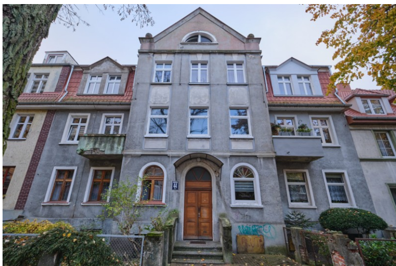
Widok elewacji frontowej od północy

7. Fotografia z opisem wskazującym orientację albo mapa z zaznaczonym stanowiskiem archeologicznym