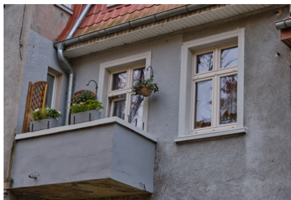
Widok na balkon flankujący ryzalit