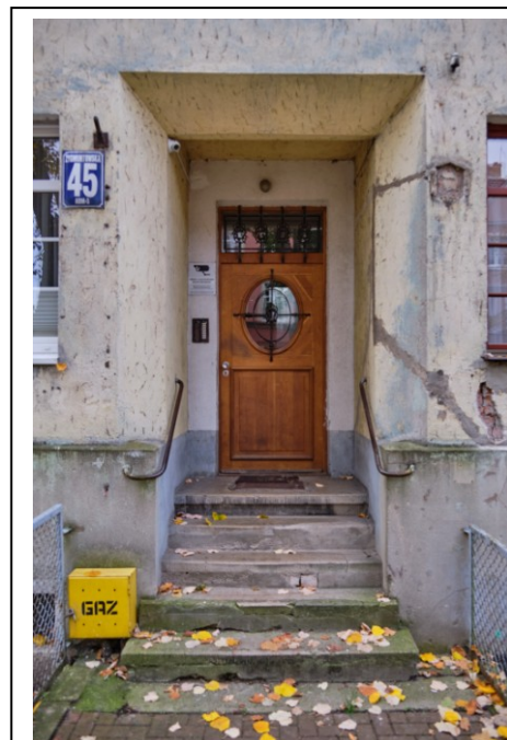
Wejście frontowe do kamienicy