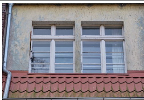
Okna trzeciej kondygnacji