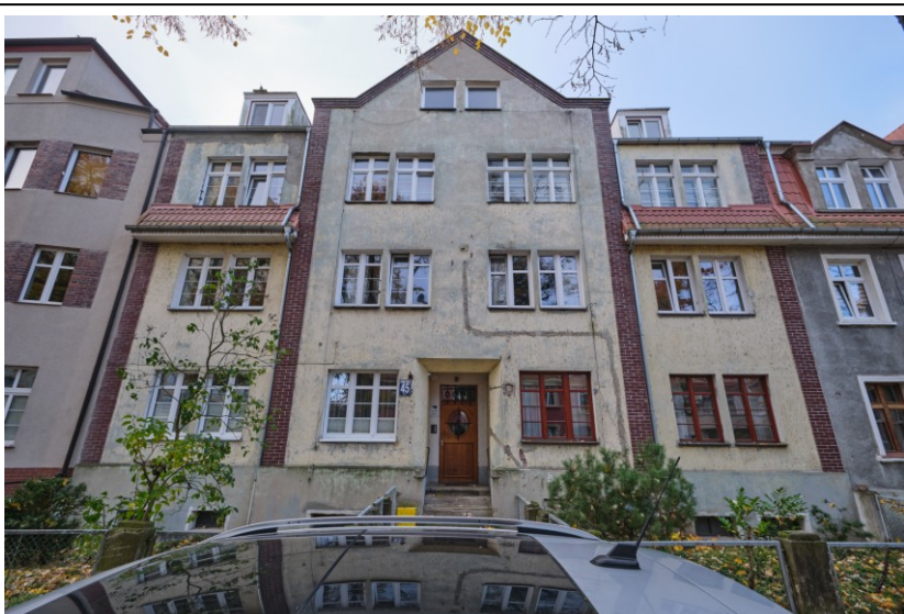
Widok elewacji frontowej

7. Fotografia z opisem wskazującym orientację albo mapa z zaznaczonym stanowiskiem archeologicznym