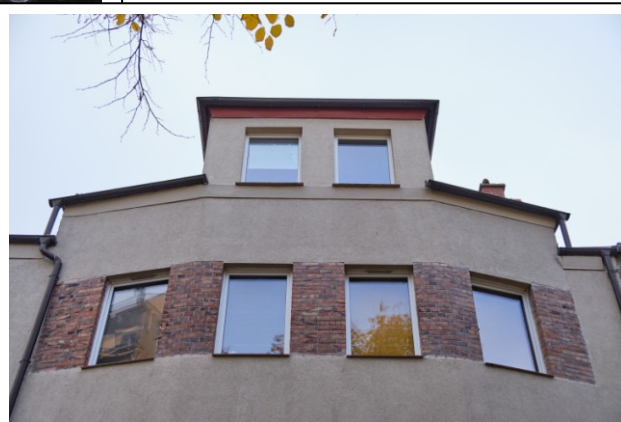
Widok na szczyt elewacji w części zach.