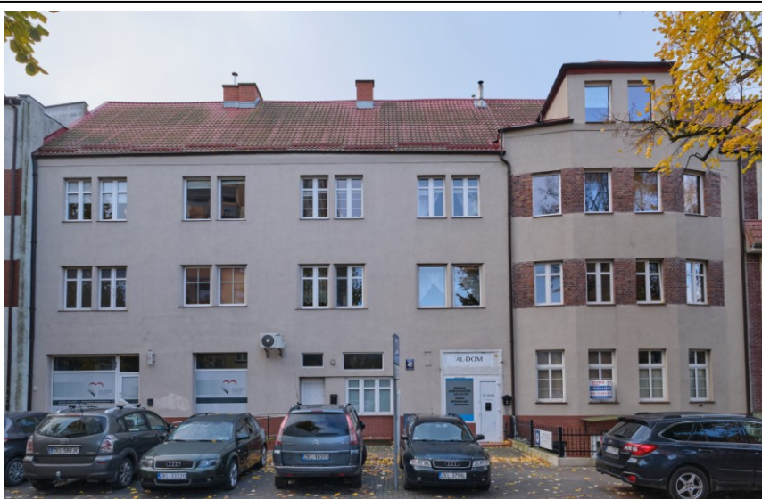
Widok elewacji frontowej

7. Fotografia z opisem wskazującym orientację albo mapa z zaznaczonym stanowiskiem archeologicznym