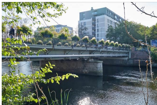
Widok ogólny od północy

7. Fotografia z opisem wskazującym orientację albo mapa z zaznaczonym stanowiskiem archeologicznym