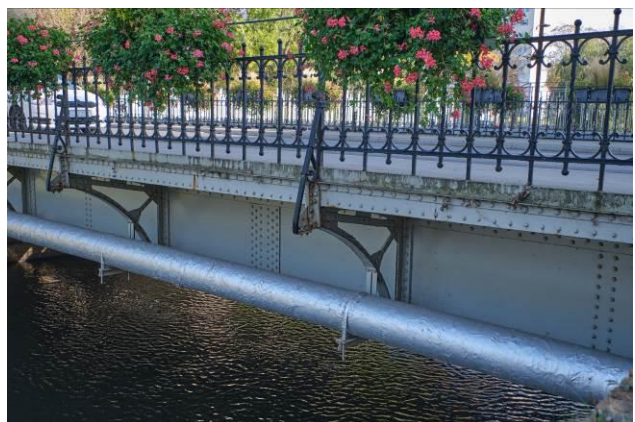
Nitowana konstrukcja przęsła mostowego