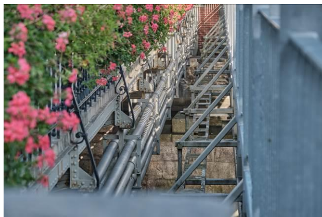
Szacht instalacyjny sieci miejskich podwieszony do mostu