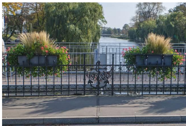
Kotwica jako element dekoracyjny żelaznej balustrady