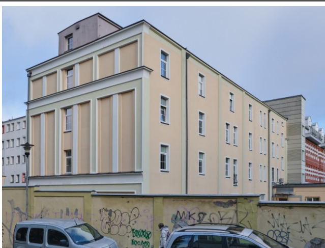
Widok ogólny od południa