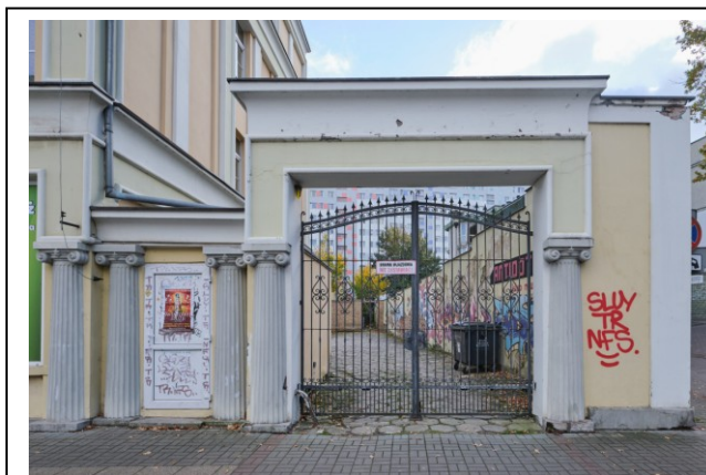
Furtka i bram na podwórze