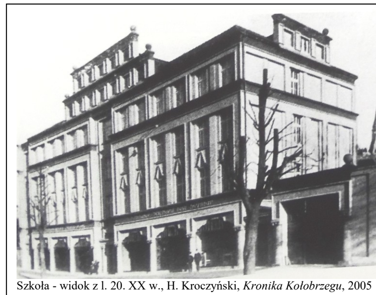
Szkoła - widok z l. 20. XX w., H. Kroczyński, Kronika Kołobrzegu , 2005