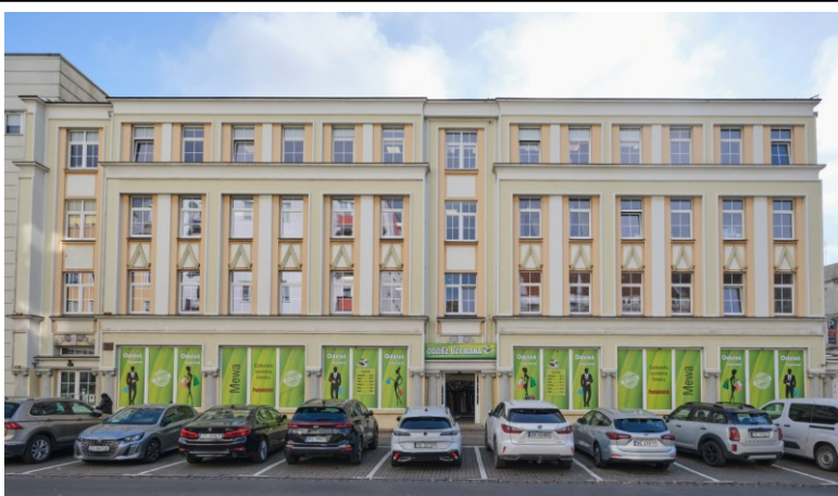
Elewacja frontowa (płn.-zachodnia)

7. Fotografia z opisem wskazującym orientację albo mapa z zaznaczonym stanowiskiem archeologicznym