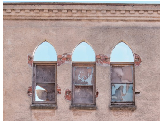
Widok ogólny od wschodu