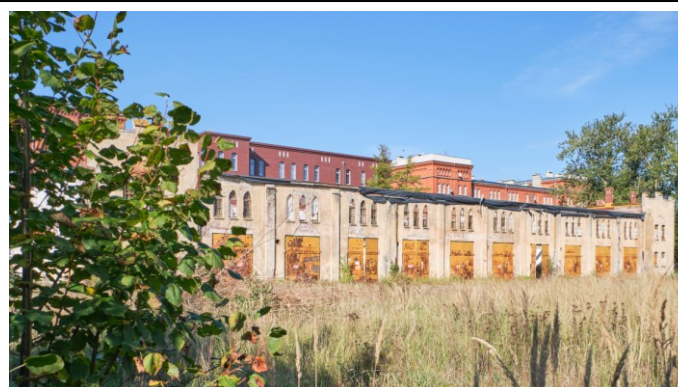
Widok ogólny od wschodu