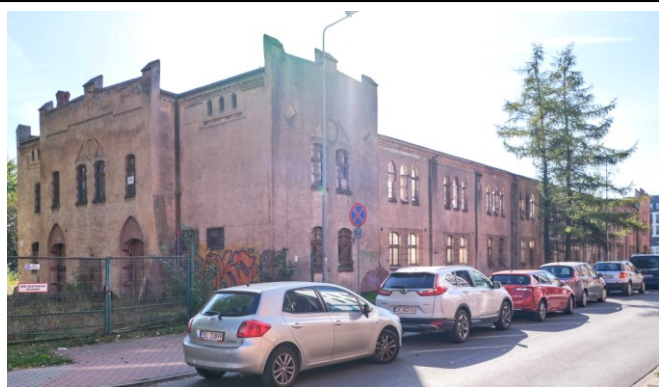
Ceglane lizeny pośrodku fasady

Obiekt ujęty w Gminnej Ewidencji Zabytków na podstawie Zarządzenia Nr 87/14 Prezydenta Miasta Kołobrzeg z dn. 21.10.2014 r. (aktualizacja: zarządzenie nr 101/22 z dn. 26.08.2022 r.)