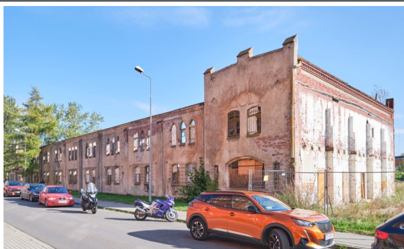
Widok ogólny od północy

7. Fotografia z opisem wskazującym orientację albo mapa z zaznaczonym stanowiskiem archeologicznym