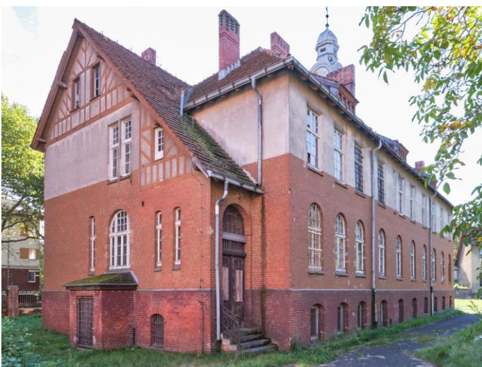
Widok ogólny od północy