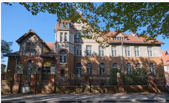
Elewacja frontowa z ogrodzeniem

7. Fotografia z opisem wskazującym orientację albo mapa z zaznaczonym stanowiskiem archeologicznym