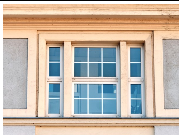
Okno w szczycie wschodnim