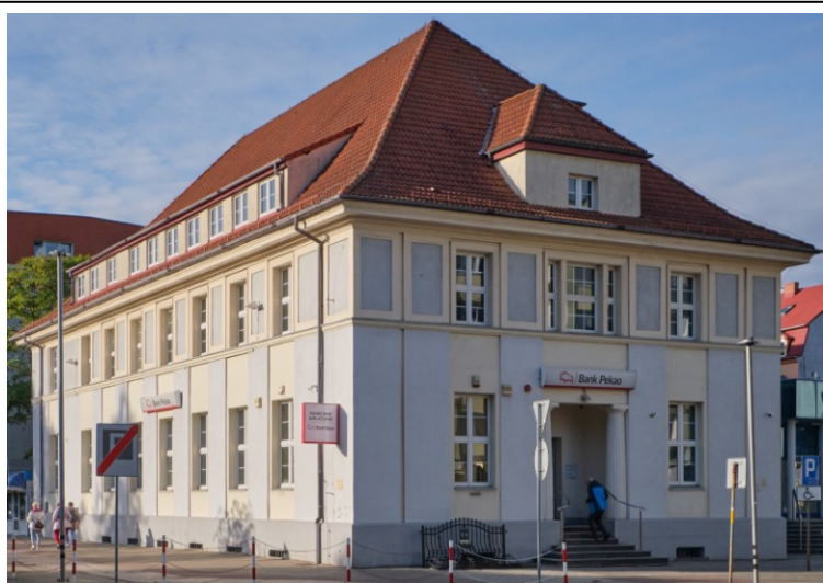
Widok ogólny od południa

7. Fotografia z opisem wskazującym orientację albo mapa z zaznaczonym stanowiskiem archeologicznym