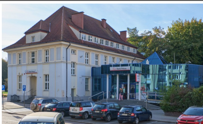
Widok ogólny od wschodu

Obiekt ujęty w Gminnej Ewidencji Zabytków na podstawie Zarządzenia Nr 87/14 Prezydenta Miasta Kołobrzeg z dn. 21.10.2014 r. (aktualizacja: zarządzenie nr 101/22 z dn. 26.08.2022 r.)