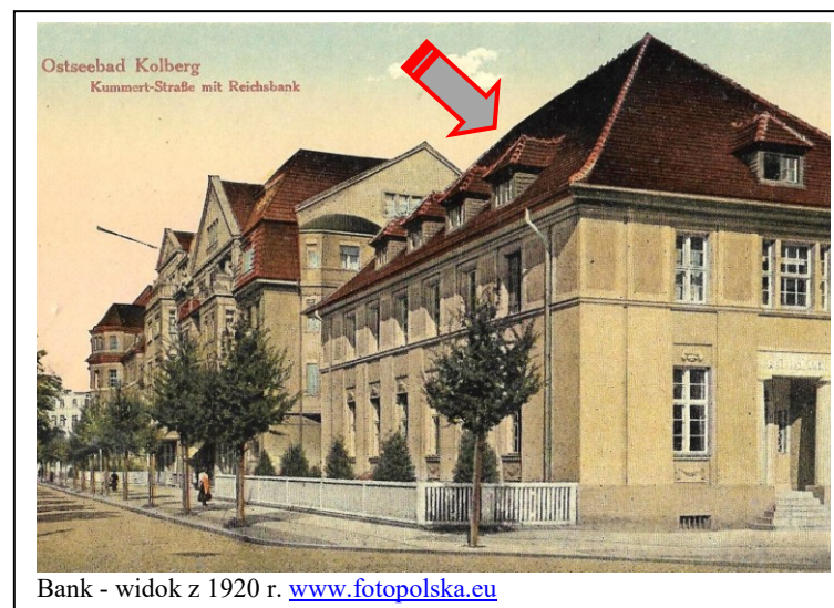
Bank - widok z 1920 r.