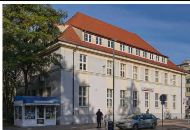
Widok ogólny od zachodu