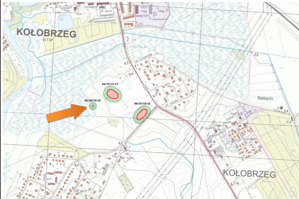
Obszar stanowiska przedstawiony w szerszym kontekście

Lachowicz F., karta ewidencji stanowiska archeologicznego, arkusz AZP 15-15/36/65, 1987.