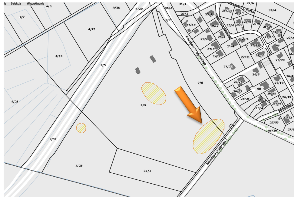
Obszar stanowiska na mapie – https://mapy.gis.kolobrzeg.pl

Ochrona polega na ograniczeniu ingerencji w grunt. Prowadzenie wszelkich prac związanych z ingerencją w grunt, w tym robót budowlanych wymaga uzyskania pozwolenia od wojewódzkiego konserwatora zabytków. W przypadku prowadzenia robót ziemnych, związanych z inwestycjami, należy przeprowadzić archeologiczne badania terenowe w niezbędnym zakresie, który zgodnie z art. 31 ustawy z dnia 23.07.2003 r. określi na wniosek inwestora wojewódzki konserwator zabytków.