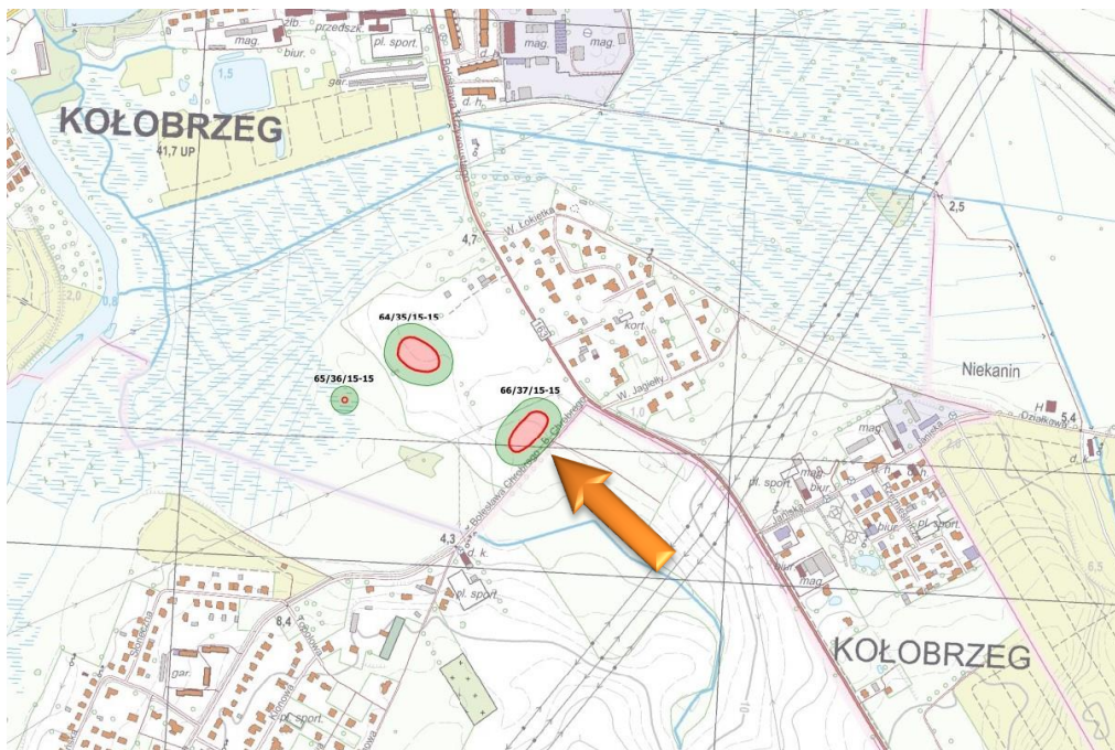
Obszar stanowiska ukazany w szerszym kontekście

Lachowicz F., karta ewidencji stanowiska archeologicznego, arkusz AZP 15-15/37/66, 1987.