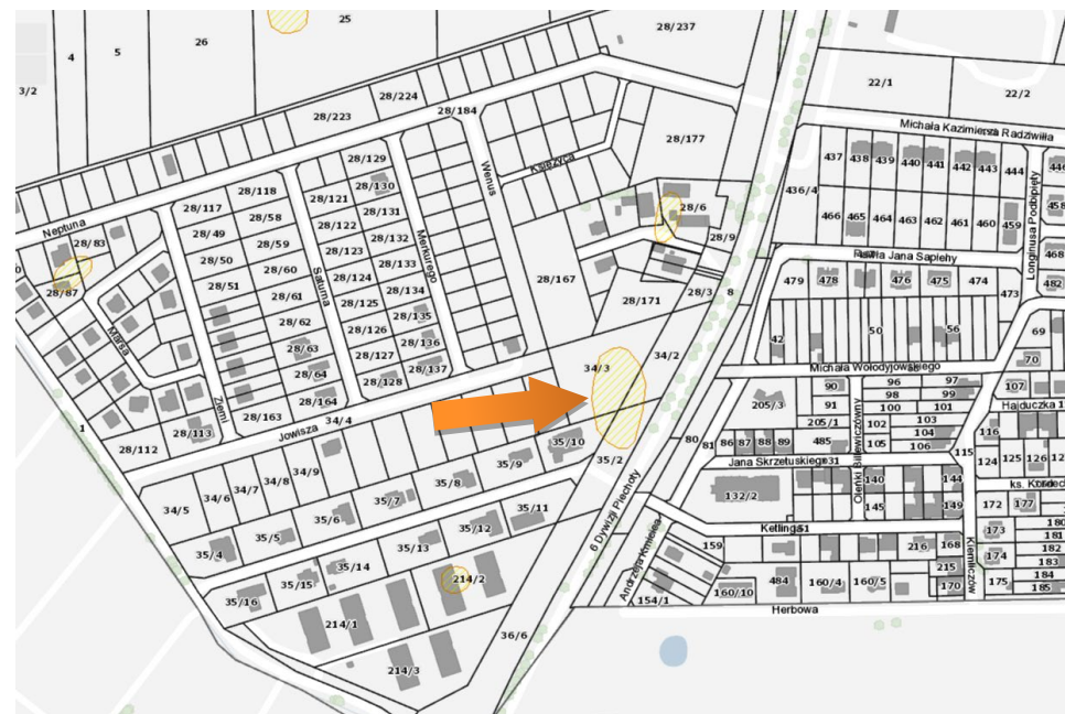
Obszar stanowiska na mapie – https://mapy.gis.kolobrzeg.pl

Ochrona polega na ograniczeniu ingerencji w grunt. Prowadzenie wszelkich prac związanych z ingerencją w grunt, w tym robót budowlanych wymaga uzyskania pozwolenia od wojewódzkiego konserwatora zabytków. W przypadku prowadzenia robót ziemnych, związanych z inwestycjami, należy przeprowadzić archeologiczne badania terenowe w niezbędnym zakresie, który zgodnie z art. 31 ustawy z dnia 23.07.2003 r. określi na wniosek inwestora wojewódzki konserwator zabytków.