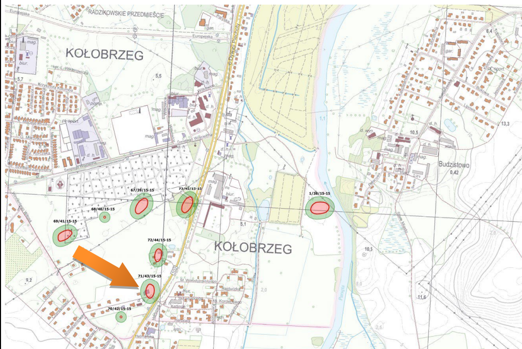
Obszar stanowiska przedstawiony w szerszym kontekście

Janocha H., Lachowicz F., karta ewidencji stanowiska archeologicznego, arkusz AZP 15-15/43/71, 1987.