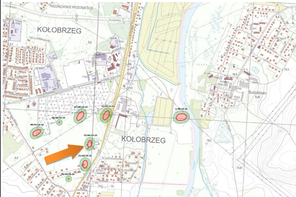
Obszar stanowiska przedstawiony w szerszym kontekście.

Lachowicz F., karta ewidencji stanowiska archeologicznego, arkusz AZP 15-15/44/72, 1987.