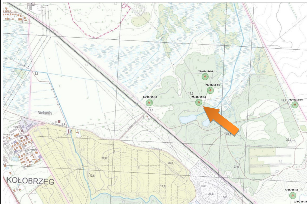
Obszar stanowiska przedstawiony w szerszym kontekście

Brzostowicz M., karta ewidencji stanowiska archeologicznego, arkusz AZP 15-16/40/75, 1990.