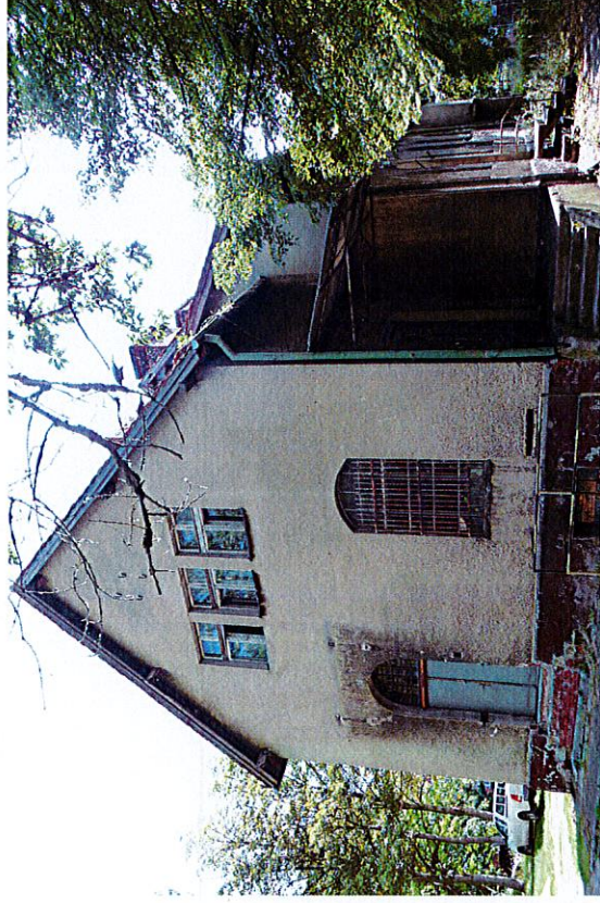
Widok budynku od zachodu

8. Fotografia z opisem wskazującym orientację albo mapa z zaznaczonym stanowiskiem archeologicznym