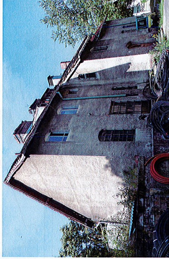
Widok budynku od wschodu