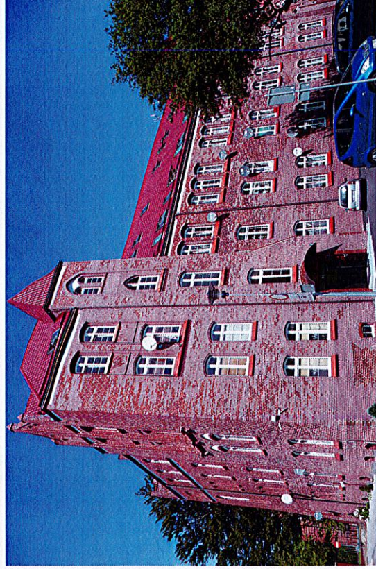
Widok budynku od południa