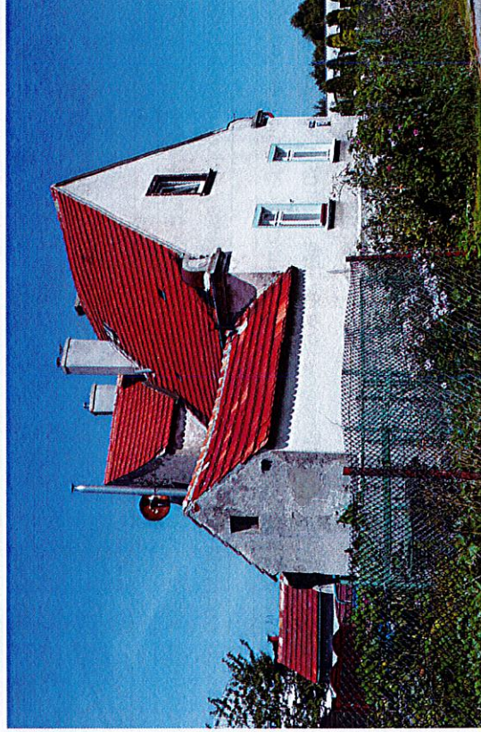
Widok budynku od południa