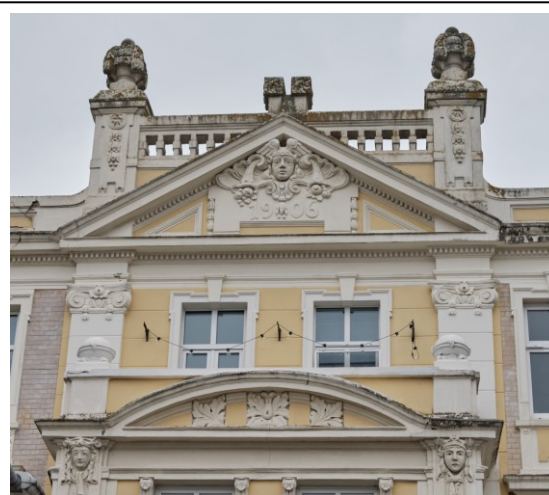
Fragment ryzalitu frontowego z datownikiem