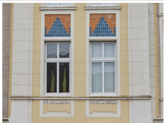
Okna na II kondygnacji

Obiekt ujęty w Gminnej Ewidencji Zabytków na podstawie Zarządzenia Nr 87/14 Prezydenta Miasta Kołobrzeg z dn. 21.10.2014 r. (aktualizacja: zarządzenie nr 101/22 z dn. 26.08.2022 r.)