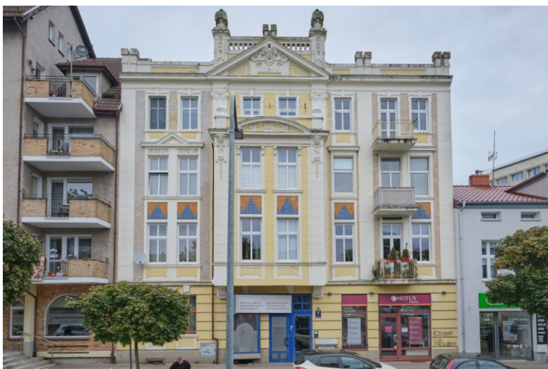
Elewacja frontowa - południowa

7. Fotografia z opisem wskazującym orientację albo mapa z zaznaczonym stanowiskiem archeologicznym