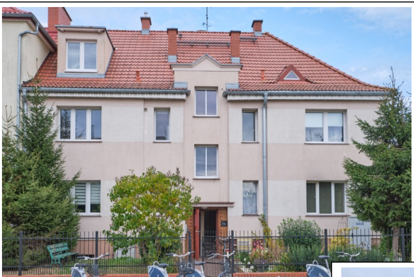
Elewacja frontowa - zachodnia

7. Fotografia z opisem wskazującym orientację albo mapa z zaznaczonym stanowiskiem archeologicznym