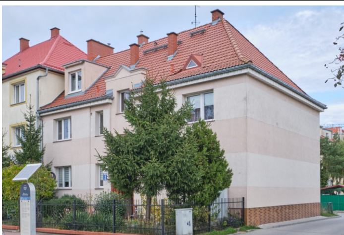
Widok ogólny od południa