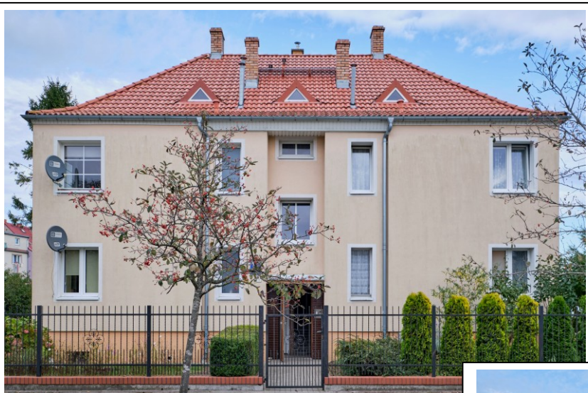
Elewacja frontowa - zachodnia

7. Fotografia z opisem wskazującym orientację albo mapa z zaznaczonym stanowiskiem archeologicznym