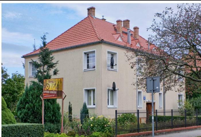
Widok ogólny od płn.-zachodu