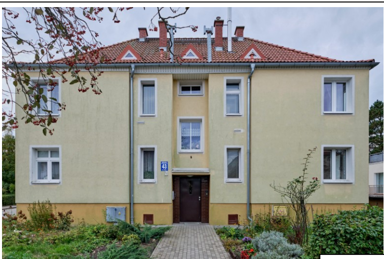
Elewacja frontowa – pñ.-wschodnia

7. Fotografia z opisem wskazującym orientację albo mapa z zaznaczonym stanowiskiem archeologicznym