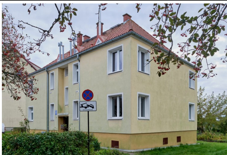
Widok ogólny od północy