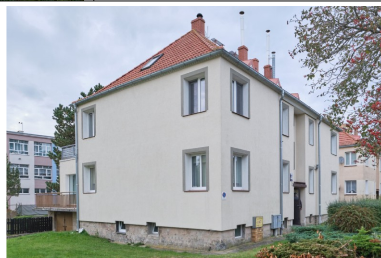
Widok ogólny od płd.-wschodu