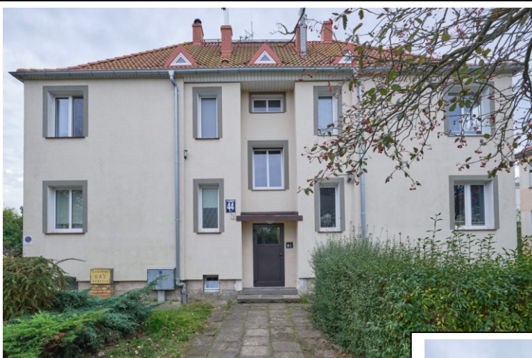
Elewacja frontowa – płn.-wschodnia

7. Fotografia z opisem wskazującym orientację albo mapa z zaznaczonym stanowiskiem archeologicznym