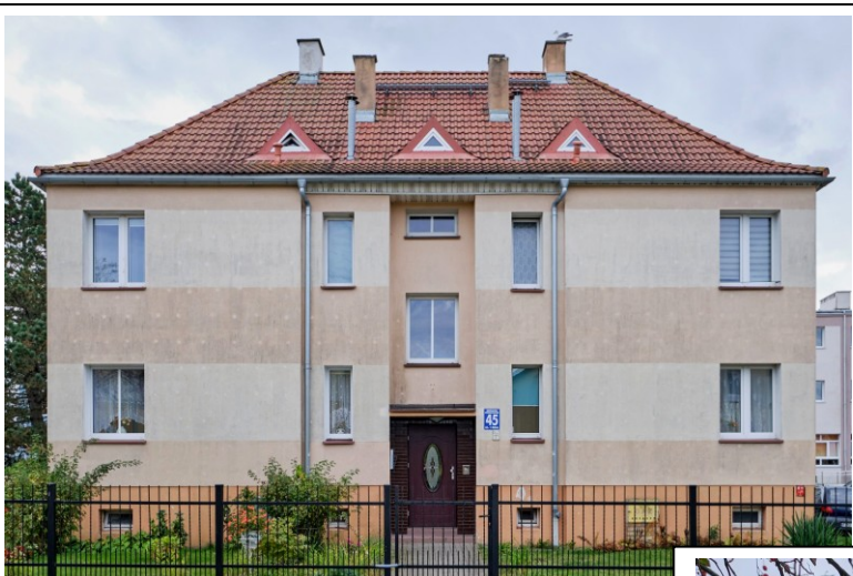
Elewacja frontowa – płn.-wschodnia

7. Fotografia z opisem wskazującym orientację albo mapa z zaznaczonym stanowiskiem archeologicznym