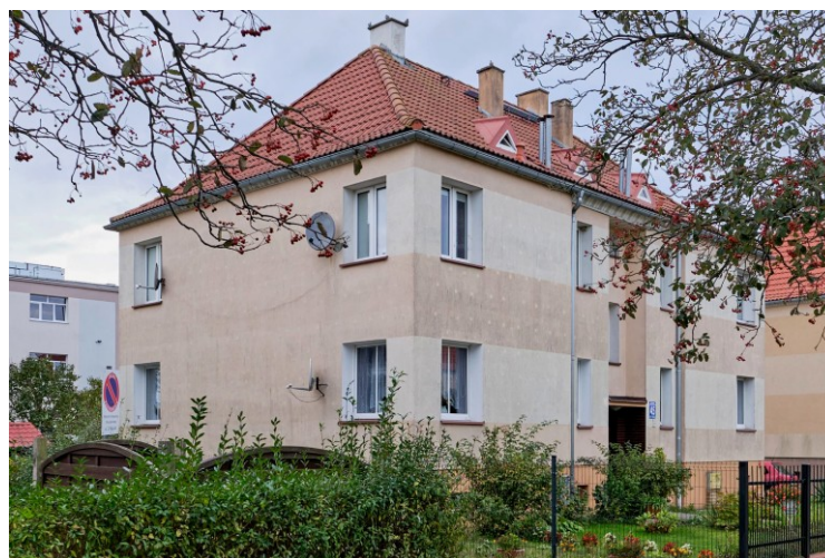
Widok ogólny od płd.-wschodu