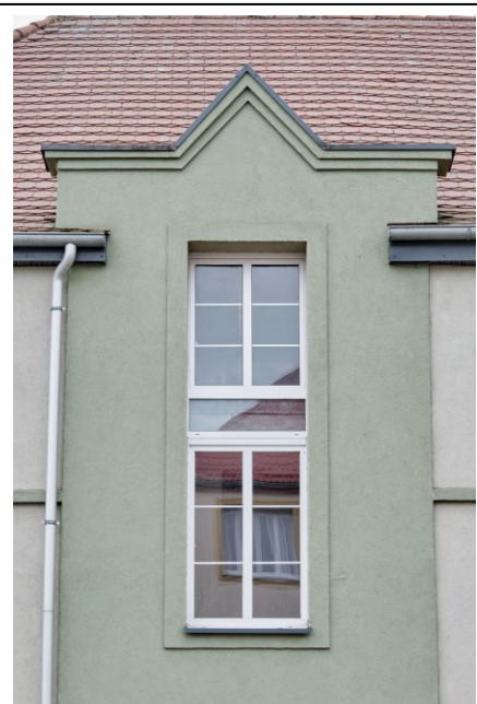
Okna klatki schodowej z attyką