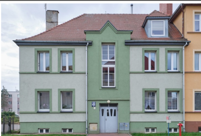
Elewacja frontowa – pñ.-wschodnia

7. Fotografia z opisem wskazującym orientację albo mapa z zaznaczonym stanowiskiem archeologicznym