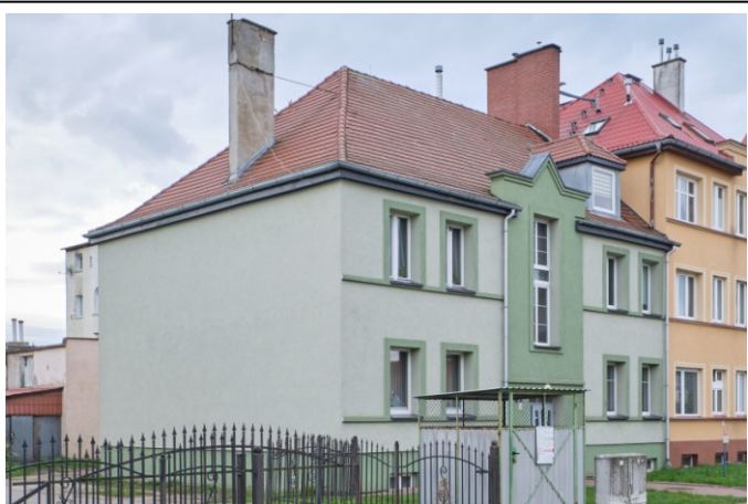
Widok ogólny od pñd.-wschodu