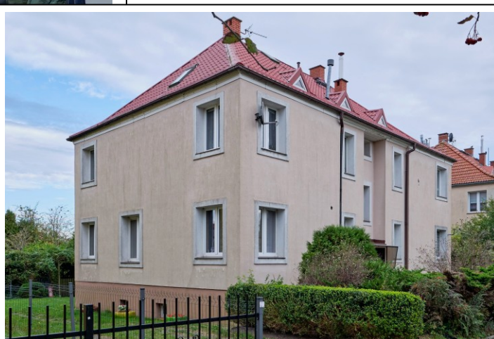
Widok ogólny od południa