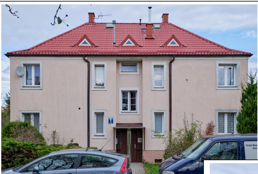
Elewacja frontowa płd.-zachodnia

7. Fotografia z opisem wskazującym orientację albo mapa z zaznaczonym stanowiskiem archeologicznym