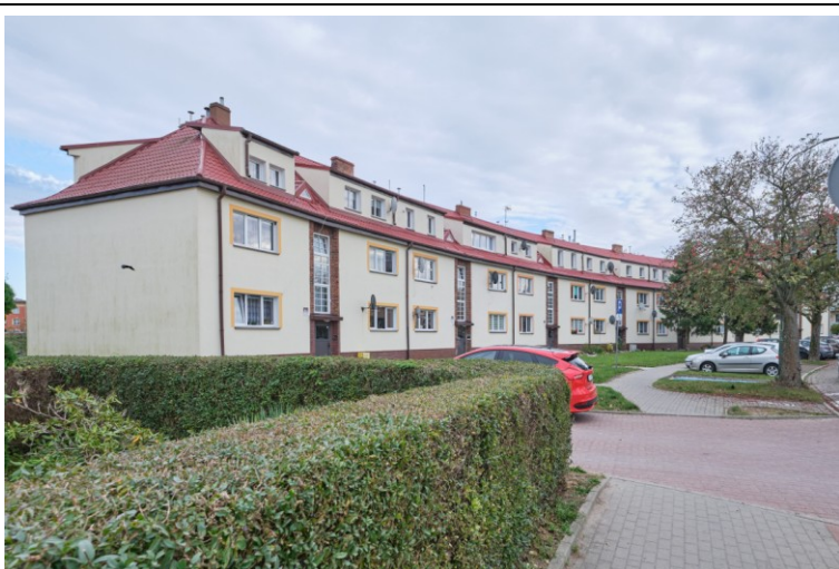
Widok ogólny bryły od pñ.-zachodu

7. Fotografia z opisem wskazującym orientację albo mapa z zaznaczonym stanowiskiem archeologicznym