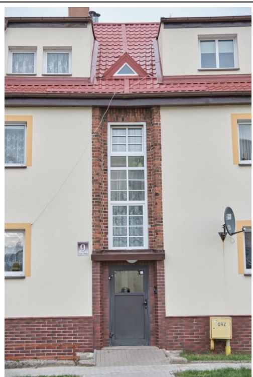
Wejście z oknem klatki schodowej