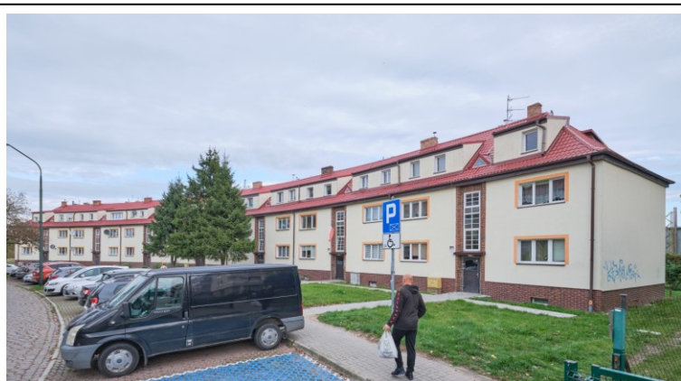
Widok ogólny bryły od pñd.-zachodu