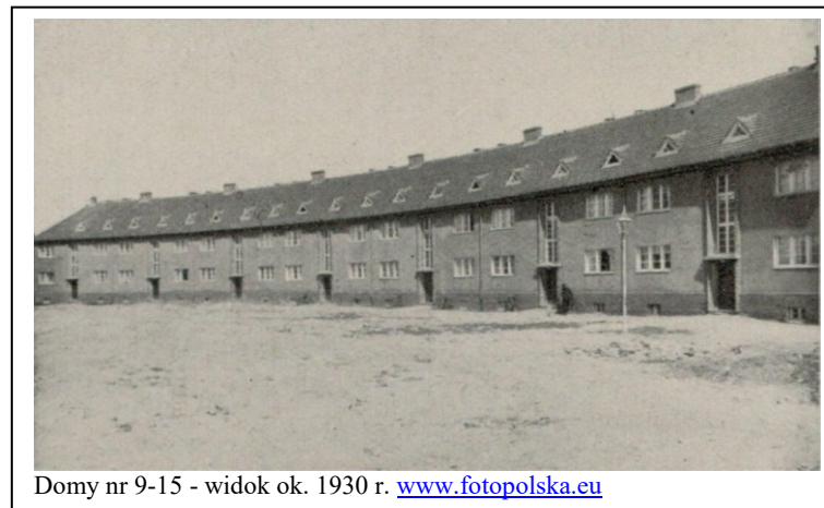
Domy nr 9-15 - widok ok. 1930 r.