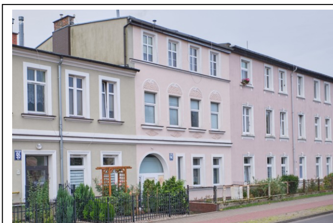
Kamienica w pierzei zabudowy – widok od północy