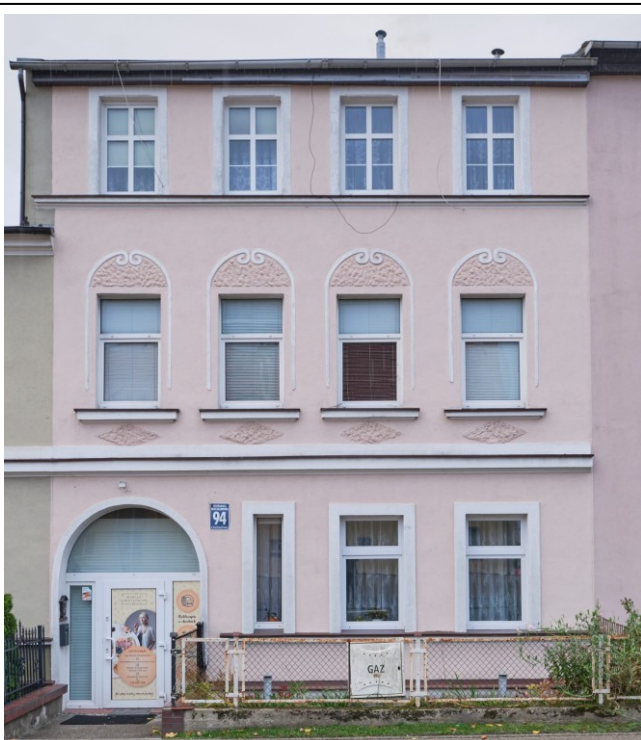
Elewacja frontowa - zachodnia

7. Fotografia z opisem wskazującym orientację albo mapa z zaznaczonym stanowiskiem archeologicznym