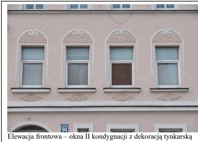
Elewacja frontowa – okna II kondygnacji z dekoracją tynkarską