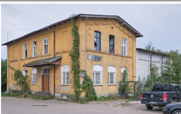
Widok ogólny od płn.-zachodu – przed pożarem