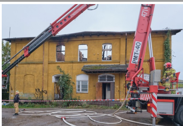
Elewacja północna – po pożarze