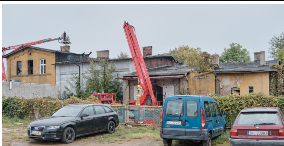
Widok ogólny od zachodu – po pożarze

7. Fotografia z opisem wskazującym orientację albo mapa z zaznaczonym stanowiskiem archeologicznym