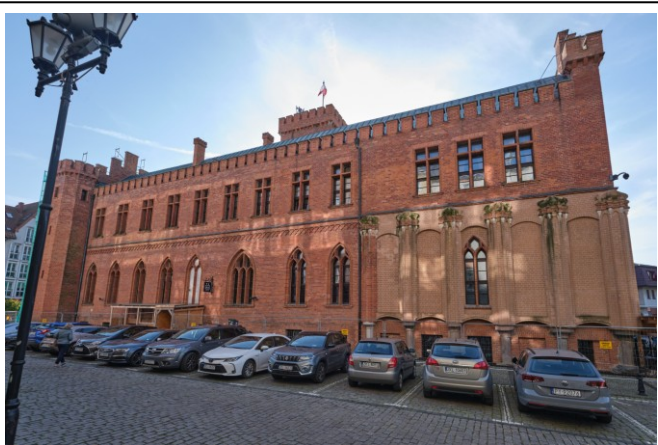
Elewacja północno-wschodnia ratusza