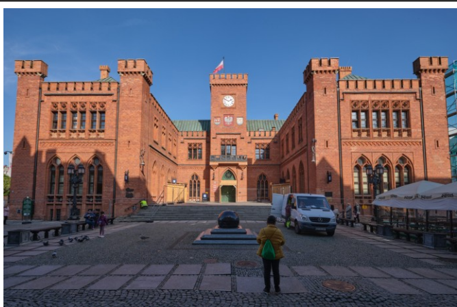
Widok frontowy bryły ratusza od strony południowej

7. Fotografia z opisem wskazującym orientację albo mapa z zaznaczonym stanowiskiem archeologicznym