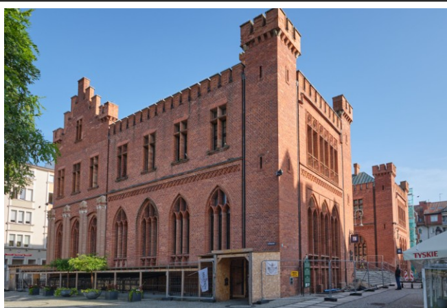
Widok ogólny bryły ratusza od zachodu