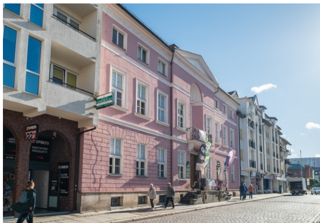
Widok fasady w zabudowie pierzejowej ulicy Armii Krajowej