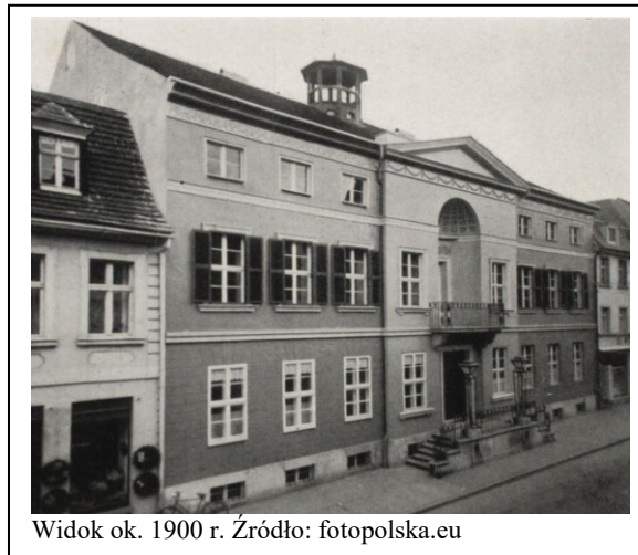
Widok ok. 1900 r.

/ukształtowania bryły (w tym gabaryty wysokościowe, proporcje wysokości ścian i dachu, forma dachu)/ konstrukcji i materiału budowlanego/ ukształtowania elewacji, w tym rozmieszczenia i formy otworów okiennych, drzwiowych oraz detalu architektonicznego/ stolarki okiennej i drzwiowej, przy wymianie wymagane jest odtworzenie poprzedniej formy i zastosowanie pierwotnego rodzaju materiału/ zasadniczego układu oraz wystroju wnętrza/ bezpośredniego otoczenia obiektu zabytkowego