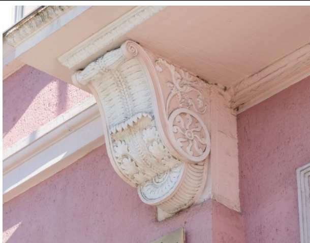
Detal wystroju sztukatorskiego fasady