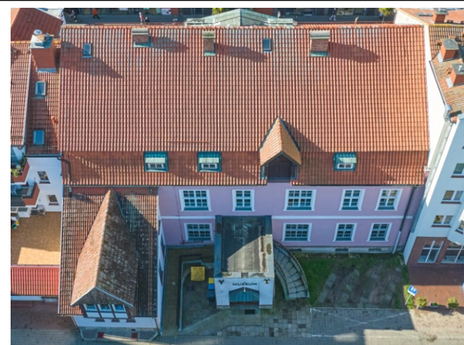
Widok elewacji tylnej z lotu ptaka od północnego wschodu