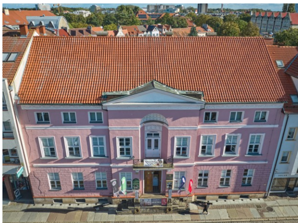
Widok frontowy pałacu z lotu ptaka od południowego zachodu

7. Fotografia z opisem wskazującym orientację albo mapa z zaznaczonym stanowiskiem archeologicznym