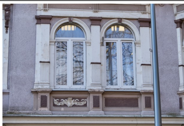
Okna na II kondygnacji z architektonicznym obramieniem