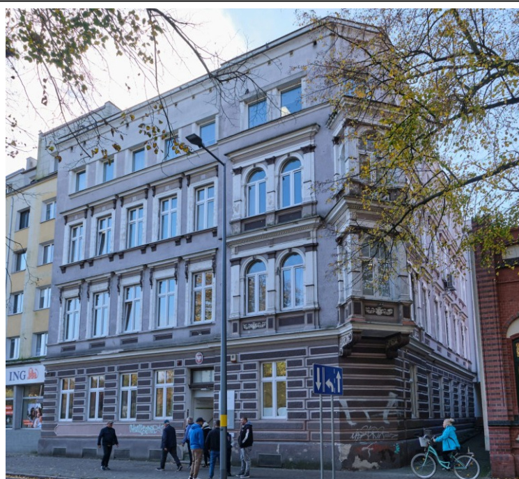
Widok ogólny od północy

7. Fotografia z opisem wskazującym orientację albo mapa z zaznaczonym stanowiskiem archeologicznym