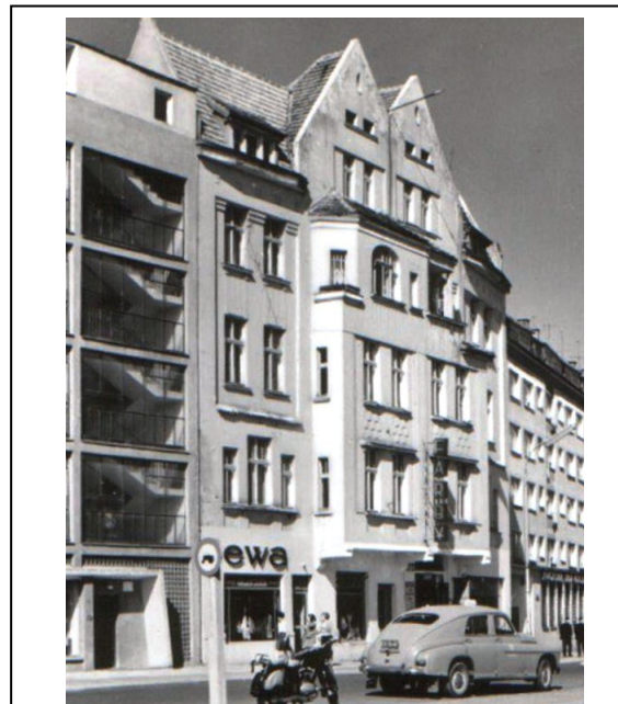
Kamienica nr 8 - widok ok. 1960 r.