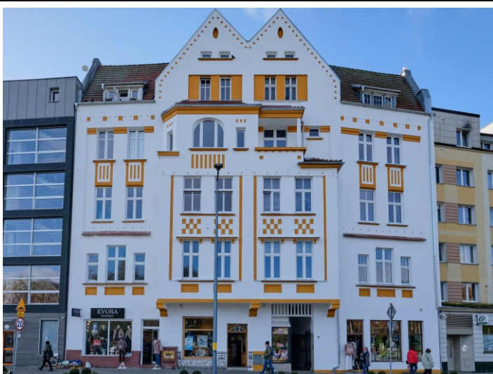
Elewacja frontowa – ph.-wschodnia

7. Fotografia z opisem wskazującym orientację albo mapa z zaznaczonym stanowiskiem archeologicznym