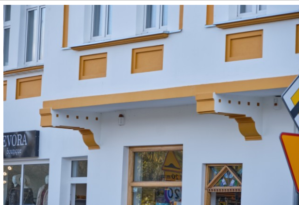
Podstawy wykuszy z kroksztykami