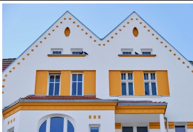
Facjata frontowa z trójkątnymi szczytami