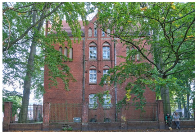
Elewacja szczytowa – półn.-zachodnia