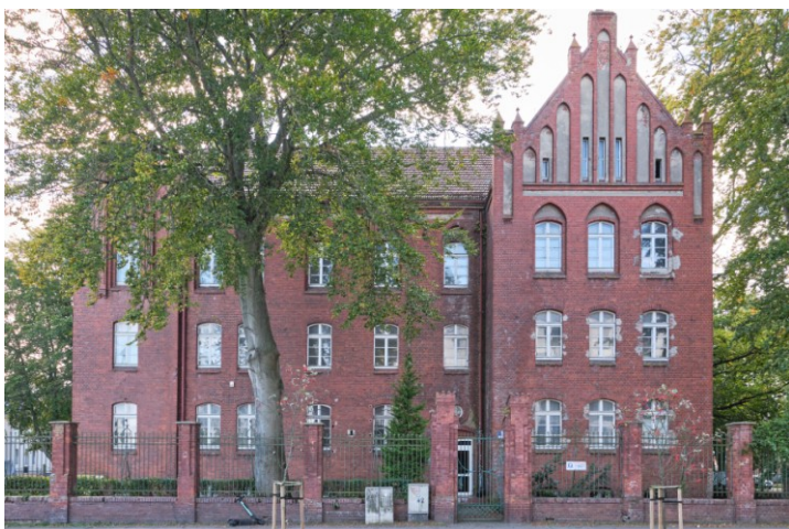
Elewacja frontowa – półn.-wschodnia

7. Fotografia z opisem wskazującym orientację albo mapa z zaznaczonym stanowiskiem archeologicznym