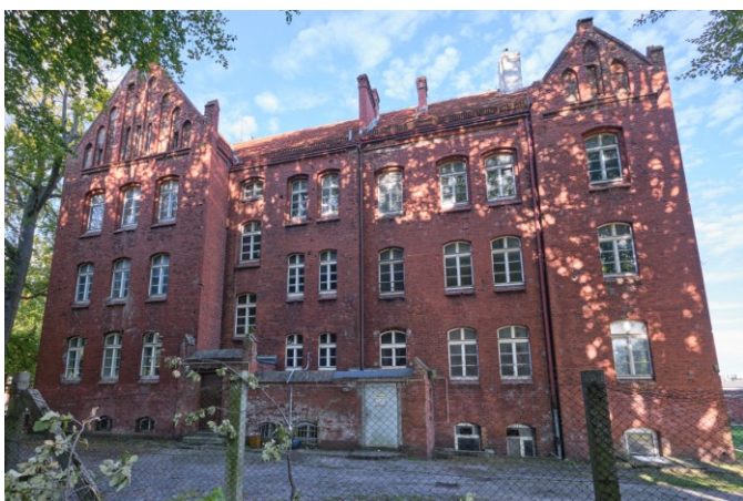
Elewacja tylna – półd.-zachodnia