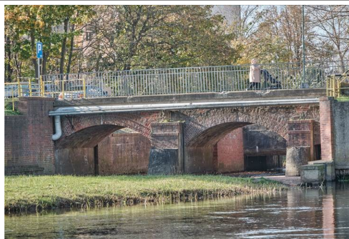
Widok ogólny mostu od strony wschodniej

7. Fotografia z opisem wskazującym orientację albo mapa z zaznaczonym stanowiskiem archeologicznym