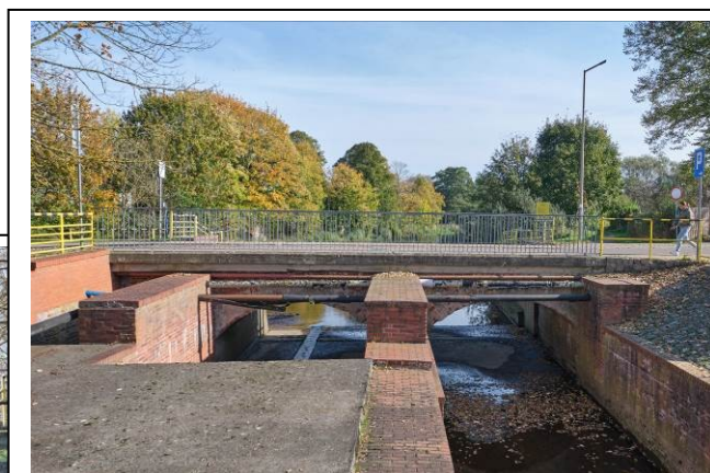
Widok ogólny mostu od strony zachodniej