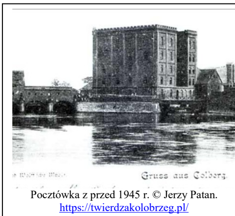
Pocztówka z przed 1945 r. © Jerzy Patan. https://twierdzakolobrzeg.pl/

- wszelkie prace budowlano-konserwatorskie winny być zgodne z zapisami mpzp oraz uzgodnione z MKZ w Kołobrzegu. ochrona w zakresie : konstrukcji i układu hydrologicznego