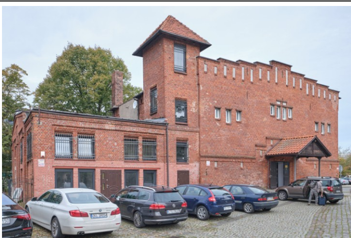
Widok ogólny od wschodu

7. Fotografia z opisem wskazującym orientację albo mapa z zaznaczonym stanowiskiem archeologicznym