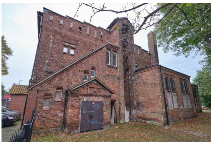
Widok ogólny od zachodu