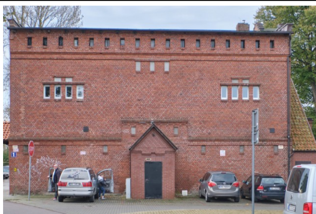
Widok ogólny od północy