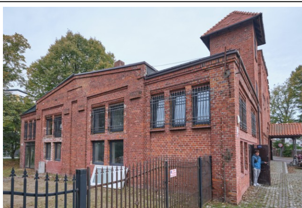
Widok ogólny od południa