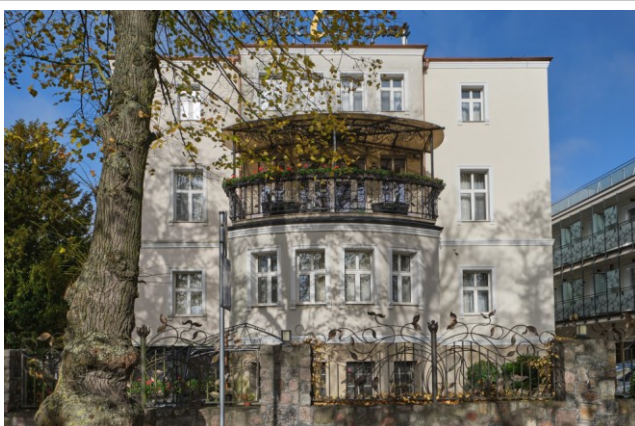
Widok ogólny od południa, z ul. Zdrojowej