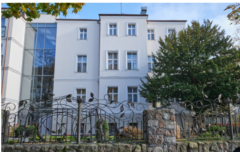
Widok ogólny od zachodu, z ul. Borzymowskiego

7. Fotografia z opisem wskazującym orientację albo mapa z zaznaczonym stanowiskiem archeologicznym