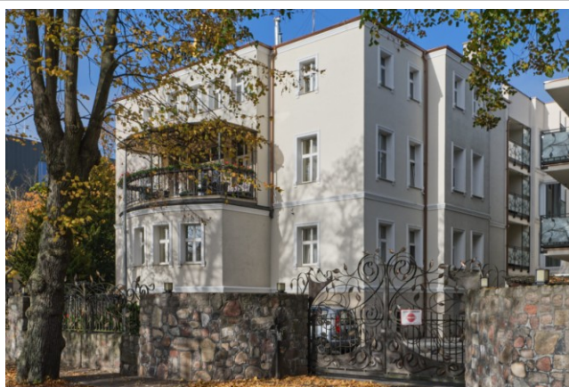
Widok ogólny pld.-wschodu