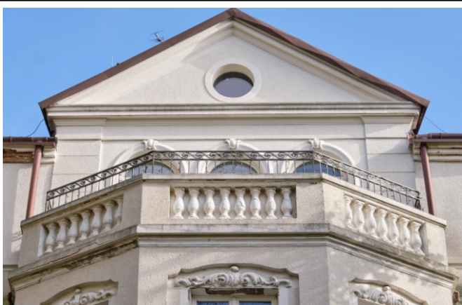
Zwieńczenie ryzalitu budynku północnego