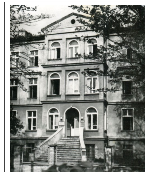
Pensjonat nr 3 - widok ok. 1960 r. www.fotopolska.eu