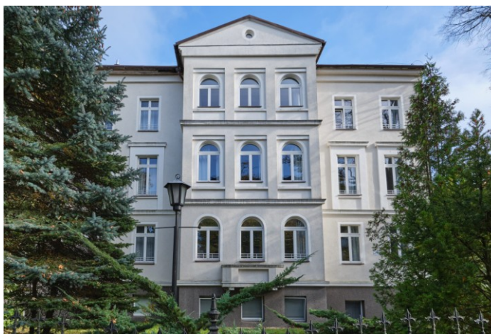
Budynek południowy (nr 3), elewacja frontowa (zachodnia)