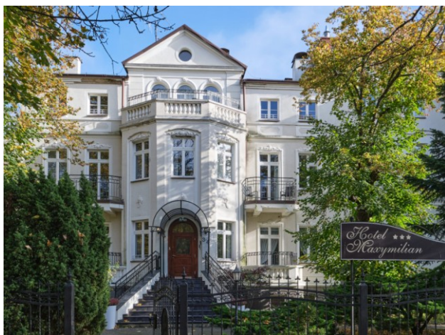
Budynek północny (nr 4), elewacja frontowa (zachodnia)

7. Fotografia z opisem wskazującym orientację albo mapa z zaznaczonym stanowiskiem archeologicznym