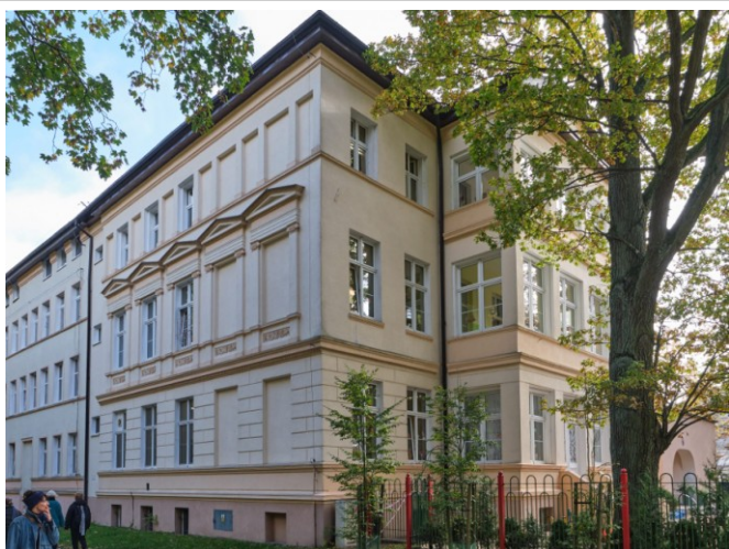
Widok ogólny od pñ.-zachodu

7. Fotografia z opisem wskazującym orientację albo mapa z zaznaczonym stanowiskiem archeologicznym