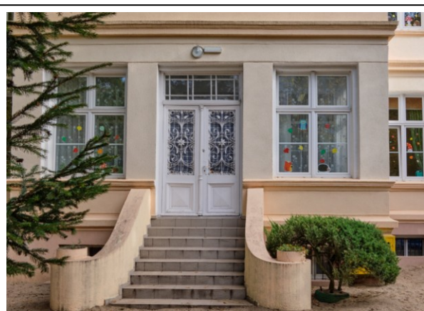
Drzwi okna w ryzalicie zachodnim

Obiekt ujęty w Gminnej Ewidencji Zabytków na podstawie Zarządzenia Nr 87/14 Prezydenta Miasta Kołobrzeg z dn. 21.10.2014 r. (aktualizacja: zarządzenie nr 101/22 z dn. 26.08.2022 r.)