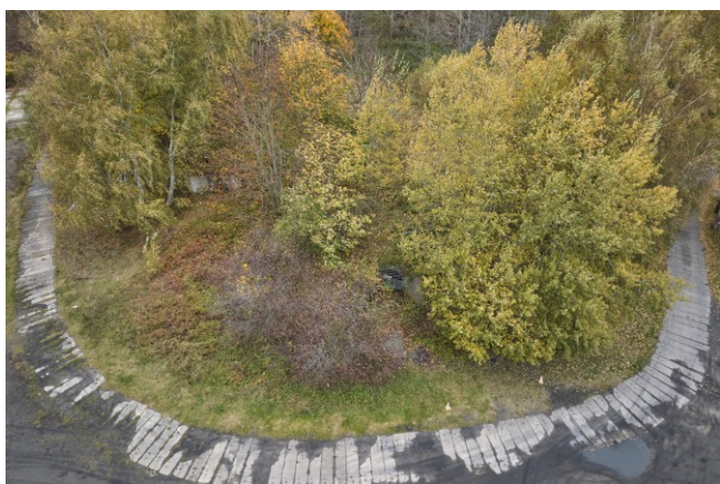
Widok ogólny z lotu ptaka od południa

7. Fotografia z opisem wskazującym orientację albo mapa z zaznaczonym stanowiskiem archeologicznym