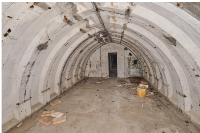
Prefabrykowana konstrukcja koleby schronu