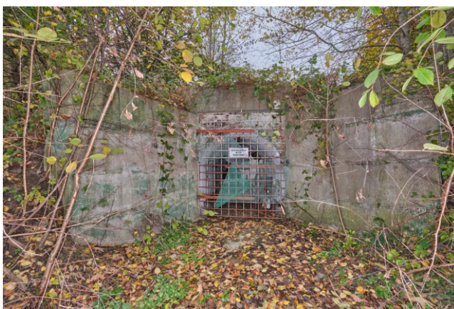
Południowe wejście do schronu dowodzenia