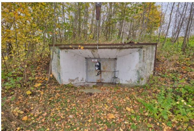
Wejście południowo wschodnie do schronu dowodzenia