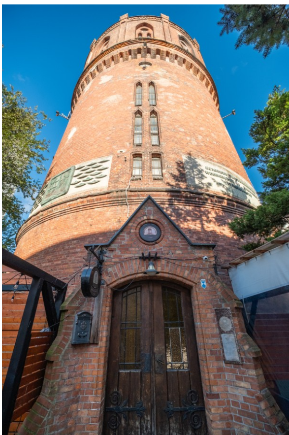
Widok części frontowej (wschodniej) bryły

Obiekt ujęty w Gminnej Ewidencji Zabytków na podstawie Zarządzenia Nr 87/14 Prezydenta Miasta Kołobrzeg, z dn. 21.10.2014 r. ( aktualizacja: zarządzenie nr 101/22, z dn. 26.08.2022 r.)