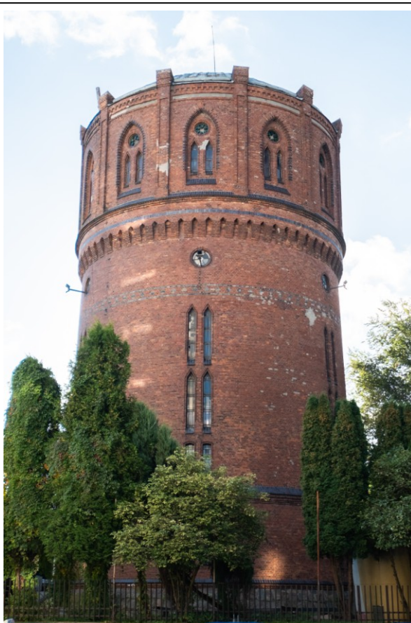
Widok ogólny bryły od południa