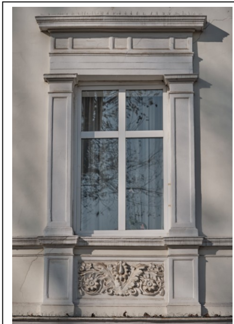
Okno II kondygnacji