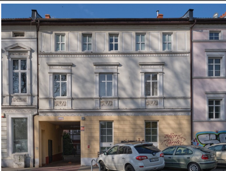
Elewacja frontowa – płd.-wschodnia

7. Fotografia z opisem wskazującym orientację albo mapa z zaznaczonym stanowiskiem archeologicznym