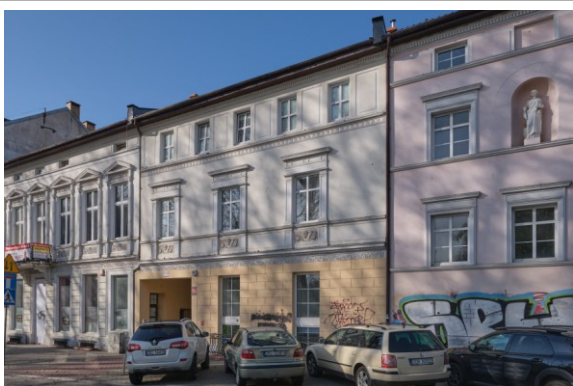
Widok ogólny w pierzei zabudowy