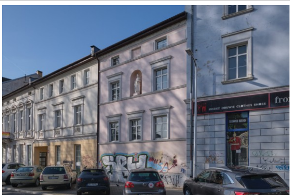
Widok ogólny w pierzei zabudowy