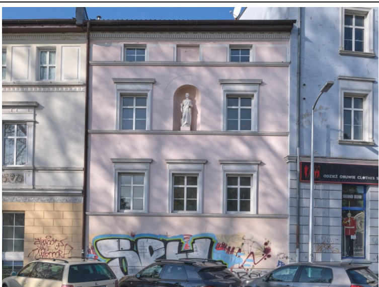
Elewacja frontowa – płd.-wschodnia

7. Fotografia z opisem wskazującym orientację albo mapa z zaznaczonym stanowiskiem archeologicznym