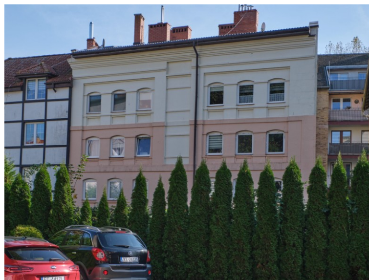
Widok ogólny od zachodu – za kanału