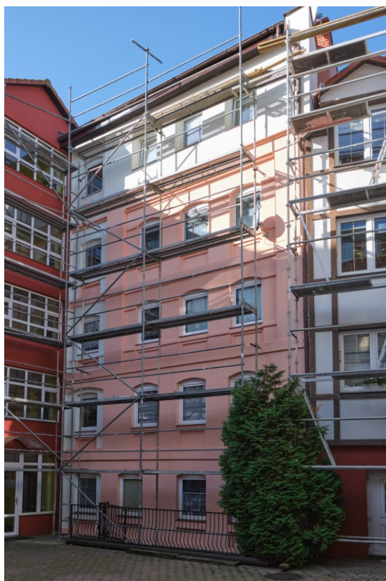
Elewacja wschodnia - podwórzowa

7. Fotografia z opisem wskazującym orientację albo mapa z zaznaczonym stanowiskiem archeologicznym