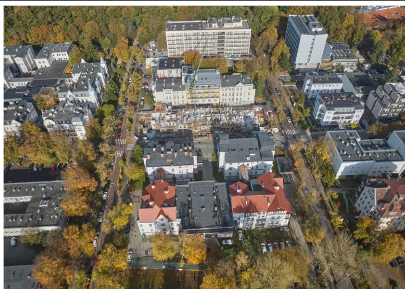
Widok dzielnicy uzdrowskiej z lotu ptaka od południa