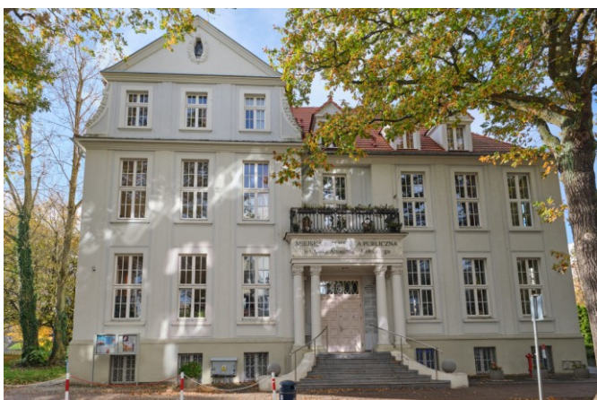
Widok frontowy bryły od strony wschodniej

7. Fotografia z opisem wskazującym orientację albo mapa z zaznaczonym stanowiskiem archeologicznym