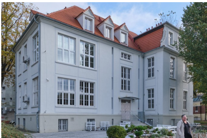
Widok ogólny bryły od strony tylnej, północno-zachodniej