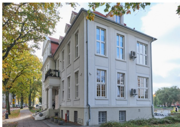
Widok ogólny bryły od strony północnej