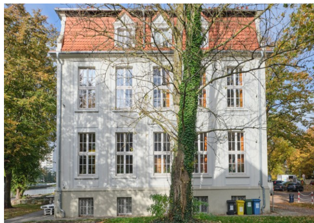
Widok na elewację boczną południową