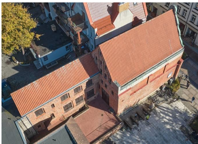
Widok ogólny z lotu ptaka od północnego zachodu