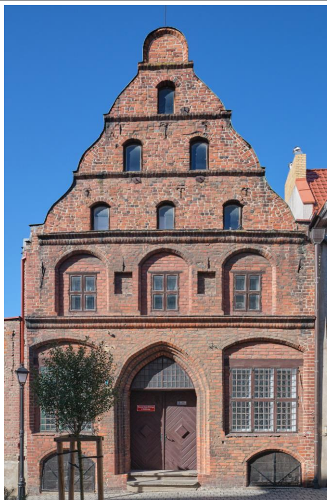
Fasada (elewacja wschodnia)

7. Fotografia z opisem wskazującym orientację albo mapa z zaznaczonym stanowiskiem archeologicznym