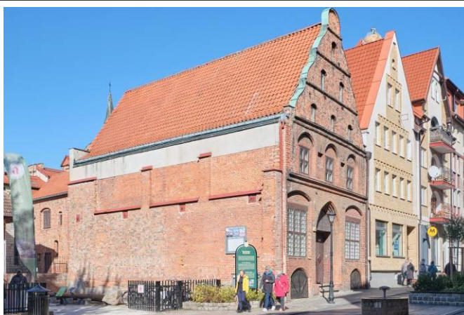
Widok ogólny bryły od południowego wschodu