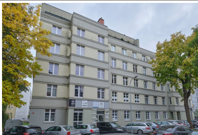
Widok ogólny bryły od strony północno-zachodniej