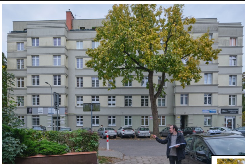
Widok ogólny bryły od strony zachodniej

7. Fotografia z opisem wskazującym orientację albo mapa z zaznaczonym stanowiskiem archeologicznym