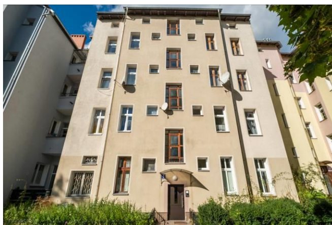
Elewacja tylna, podwórzowa (wschodnia)