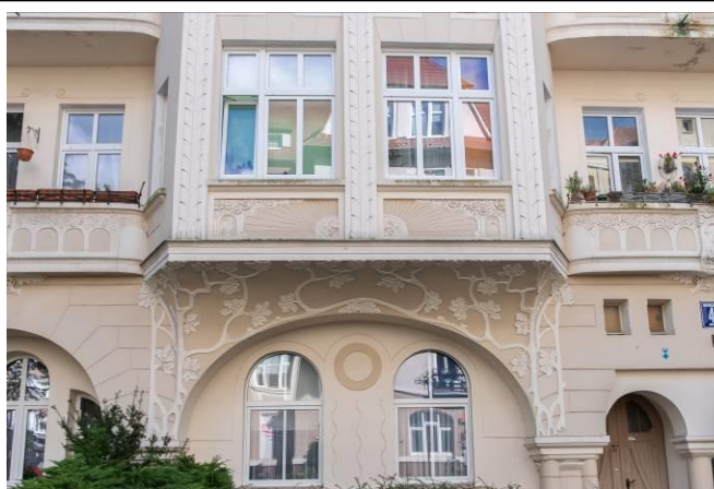
Fasada, fragment wystroju architektonicznego