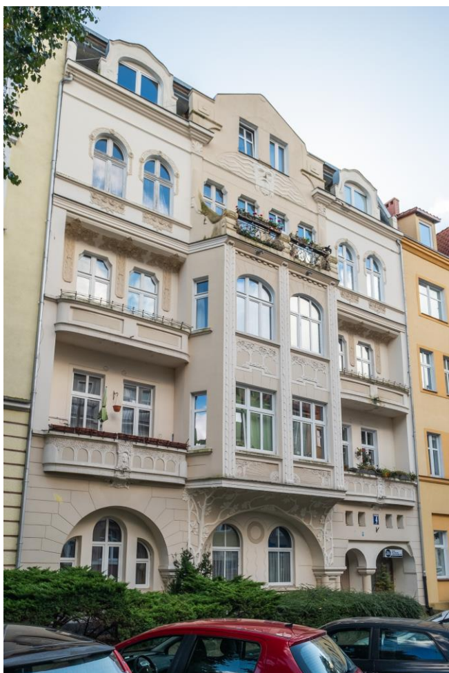
Widok ogólny fasady (elewacja zachodnia) budynku

7. Fotografia z opisem wskazującym orientację albo mapa z zaznaczonym stanowiskiem archeologicznym