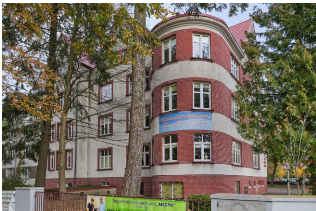
Widok ogólny bryły od strony południowo-zachodniej