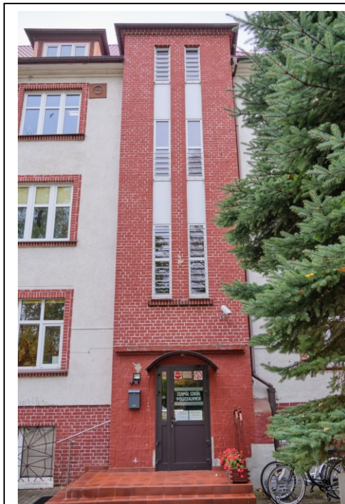
Elewacja wschodnia, ryzalit głównego wejścia