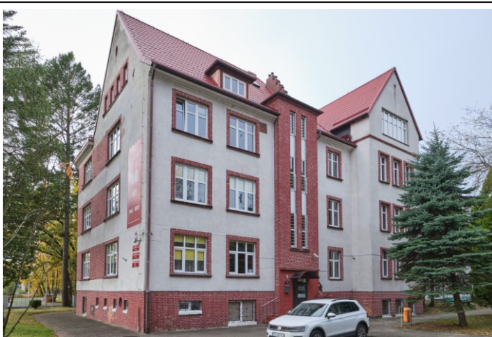
Widok ogólny bryły od strony południowo-wschodniej

7. Fotografia z opisem wskazującym orientację albo mapa z zaznaczonym stanowiskiem archeologicznym