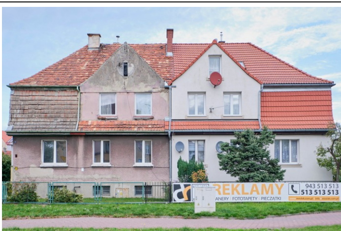
Elewacja frontowa - południowa

7. Fotografia z opisem wskazującym orientację albo mapa z zaznaczonym stanowiskiem archeologicznym