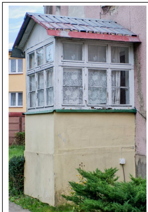
Ganek w elewacji zachodniej