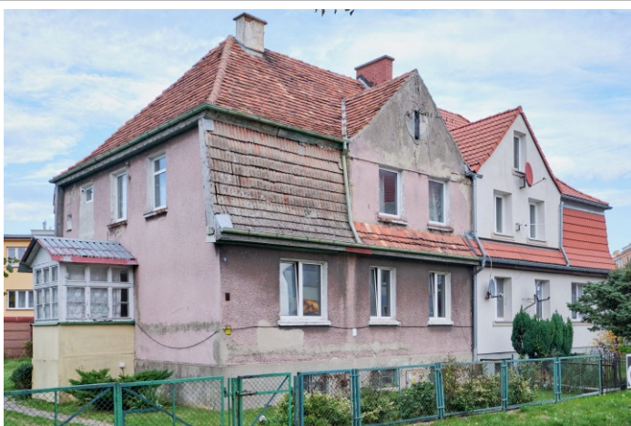
Widok ogólny od południowego-zachodu