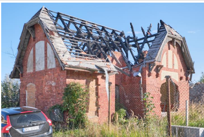
Widok ogólny od płd.-zachodu

7. Fotografia z opisem wskazującym orientację albo mapa z zaznaczonym stanowiskiem archeologicznym